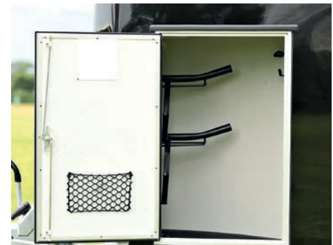
Polydach weiß, Plywood Weiß Wände, ohne Ersatzrad