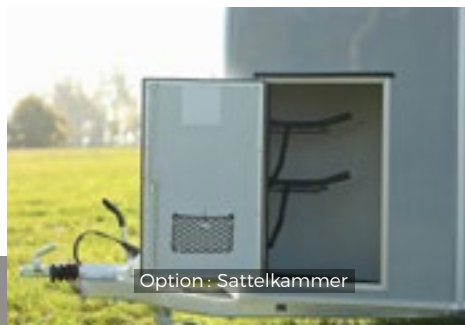
Option : Sattelkammer

+ Optionale Zusatzausstattung Sattelkammer