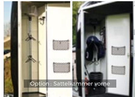
Option : Sattelkammer vorne