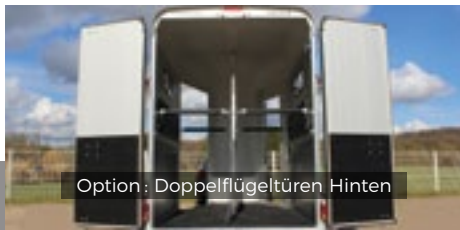
Option : Doppelflügeltüren Hinten

Ersatzrad, Doppelflügeltüren hinten, Sattelkammer vorne (Sandwich Panele)