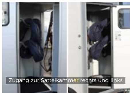
Zugang zur Sattelkammer rechts und links