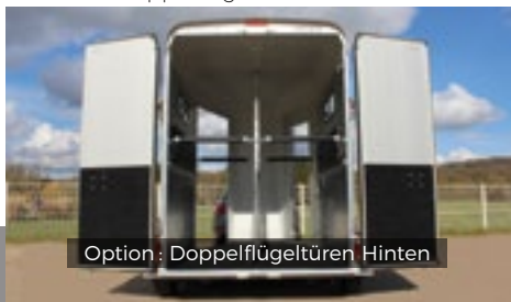
Option : Doppelflügeltüren Hinten